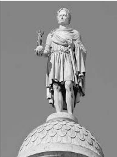
Рис. 5. Вандомська колона.

Ще одним прикладом впливу на суспільство архітектурної форми, яка водночас стає змістом, є площа Згоди в Парижі. Ми не маємо змоги проаналізувати усі зміни, які відбулися з нею, але коротко зупинимося на її композиційному центрі. З часів її заснування у 1760-их рр. такою була статуя короля Людовика XV, іменем якого тоді площа називалася. У роки Великої Французької революції статую повалили та встановили замість неї статую Свободи. Біля неї розташовувалася гільйотина, де страчували людей. За ці роки площа змінила кілька назв – Людовика XV, Згоди, Революції (рис. 4).