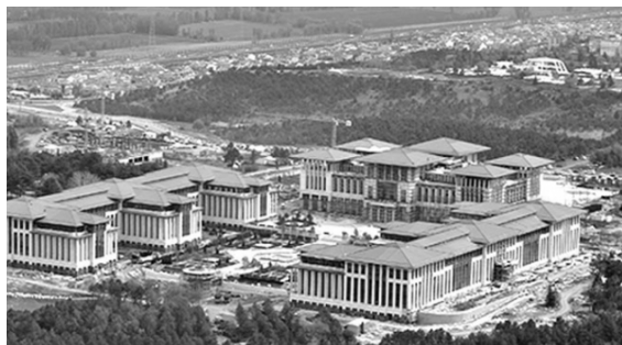
Рис. 2. Ак Сарай – резиденція Т. Ердогана.