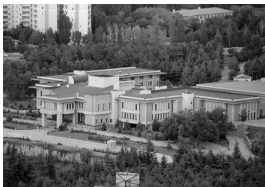
Рис. 1. Резиденція президентів Туреччини до 2014 р.

Як приклад впливу форми на розвиток соціально-політичних відносин можна навести історію президентських резиденцій Туреччини. Як відомо, упродовж тривалого періоду ХХ ст. Туреччина за формою державного правління була парламентською республікою. Фактичним главою держави був Прем'єр-міністр, натомість Президент був значною мірою символічною політичною фігурою. Резиденцією президентів країни тривалий час була Чанкайя (рис. 1). У 2011 р. в часи прем'єрства Т. Ердогана стали будувати нову резиденцію для глави уряду Ак Сарай (рис. 2), яка була розкішнішою та більшою не лише за Чанкайя, а й, як свідчать спостерігачі, за Букінгемський та Єлисейський палаці, Кремль тощо. У 2014 р. Т. Ердогана обрали Президентом Туреччини й він заявив, що не буде переїжджати до Чанкайя, а залишиться в Ак Сарай, натомість Чанкайя він «віддав» новому Прем'єру. По суті, глава держави символічно заманіфестував зміну ролей цих політичних посад. Через 3 роки відбувся референдум, на якому громадяни Туреччини підтримали поправки до конституції, якими запроваджувалася президентська форма