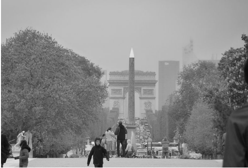
Рис. 3. Луксорський обеліск.

державного правління, зокрема Президент ставав главою виконавчої влади, а посада Прем'єра була скасована.