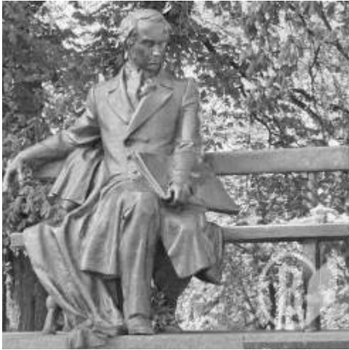
Рис. 8. Пам'ятник Т. Шевченку в Чернігові (1992).

та багатьох інших містах світу. Ситуація в Україні змінилася в останні 10–15 років ХХ ст., а також у ХХІ ст. Пам'ятники, зведені у цих роках у багатьох