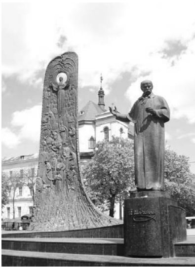
Рис. 9. Пам'ятник Т. Шевченку у Львові (1992).

та багатьох інших містах світу. Ситуація в Україні змінилася в останні 10–15 років ХХ ст., а також у ХХІ ст. Пам'ятники, зведені у цих роках у багатьох