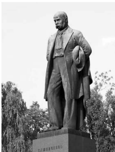
Рис. 6. Пам'ятник Т. Шевченку в Києві (1939).

Ще один приклад з історії архітектурних об'єктів демонструє, що факти активності форми об'єкта як засобу формування соціально-політичних відносин, динамізму архітектури в контексті такого формування не означають, що архітектор при створенні об'єкта нічим не обмежений. Оскільки образи політичних явищ та суб'єктів формуються в суспільній свідомості, вони вкорінені в існуючі в суспільстві інформаційні ланцюги, відтак форма архітектури та особливості сприйняття архітектурних об'єктів визначаються значною мірою традиціями, звичками, способами мислення, вона прив'язана до існуючих архетипів (хоча знову ж таки вона здатна змінюватися разом із суспільством). Дуже цікавим у цьому відношенні є приклад пам'ятників Шевченка. Якщо ми