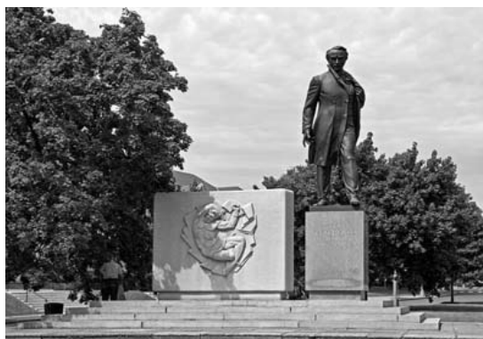
Рис. 7. Пам'ятник Т. Шевченку в Вашингтоні (1964).