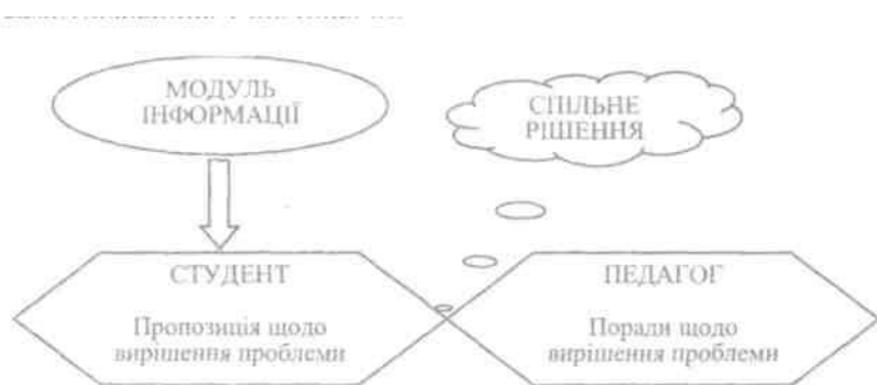
Рис. 7.1. Механізм суб'єкт-суб'єктної взаємодії педагога і студента

Останнім часом педагогічна наука все частіше звертає увагу на педагогічний процес, заснований на суб'єкт-суб'єктних відносинах, які визнають управлінську функцію педагога і функцію самоуправління учня (рис. 7.1).