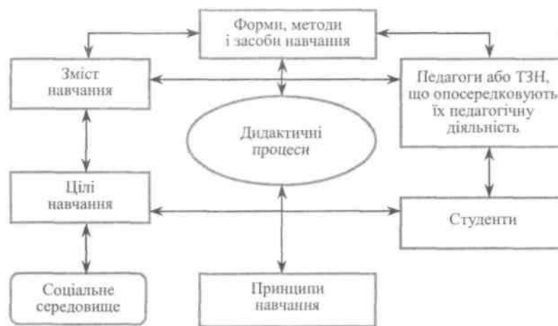
Рис. 1. Структура педагогічної системи у вищому навчальному закладі

Наприклад, широкий розвиток підприємництва і бізнесу в ХХ ст. потребував від систем освіти підготовки висококваліфікованих менеджерів, що здатні працювати самостійно, активно і творчо. При цьому соціальне замовлення торкнулося не лише змін цілей і змісту навчання, а й інших елементів: удосконалення форм і методів навчання, підвищення рівня кваліфікації педагогічного персоналу тощо.