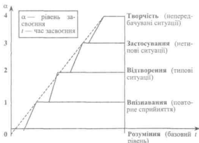
Рис.1 - Рівні засвоєння навчальної інформації за В. П. Беспалько:

5) принципи навчання (зазнають розвитку від перших курсів до старших у зв'язку з ускладненням об'єкта управління);