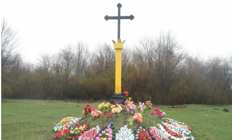
Рис. 1. Пам'ятний знак загиблим в 1932-1933рр. (с. Бесідка, Ставищенський р-н, Київська обл.)

Таким чином Голодомор став однією з найстрашніших подій минулого. Він забрав безліч невинних життів. Сьогодні ми повинні пам'ятати події тих страшних років і шанувати кожного, хто має з ними безпосередній зв'язок. «Голодомор був організований, щоб вживити нам ген «страху і покірності». Найкраща пам'ять про загиблих — знищити цей ген у собі раз і назавжди!» (С. Вакарчук)