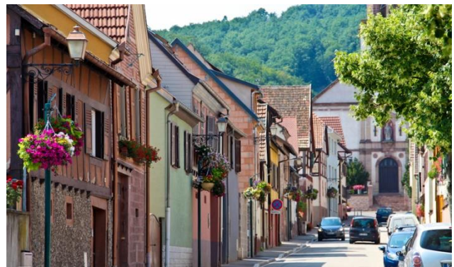
Французька модель села

Але звернемо увагу на подвійне тлумачення терміну. Одні вказують на «втечу» міщан до сільських населених пунктів від економічних, екологічних тощо проблем й часто замість «рурбанізації» вживають «руралізацію» та навіть «контрурбанізацію», інші – на прихід міського способу життя до села [1 ; 6]. Остання концепція передбачає поширення нових моделей села.