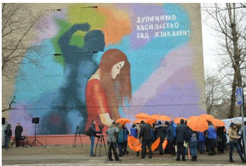
Рис 1. Мурал у Сіверодонецьку «Зупинимо насильство над жінками». [7]

Один з перших муралів в Україні, спрямований проти гендерно детермінованого насильства, був виконаний у місті Сіверодонецьку. Він був відкритий у листопаді 2016 р. Називається мурал «Зупинимо насильство над жінками» (Рис. 1). Учасники відкриття залишили помаранчеві відбитки долонь на знак несприйняття насильства [7].