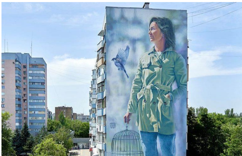
Рис. 5. Мурал в Маріуполі «Життя без насильства сповнене щастя і радості» [12]

домашнього насильства. Мерехтливі постаті на фоні зливаються в одну казкову картину та означають, що світ жінки став світлим і радісним – попереду на неї чекає щастя». [12]