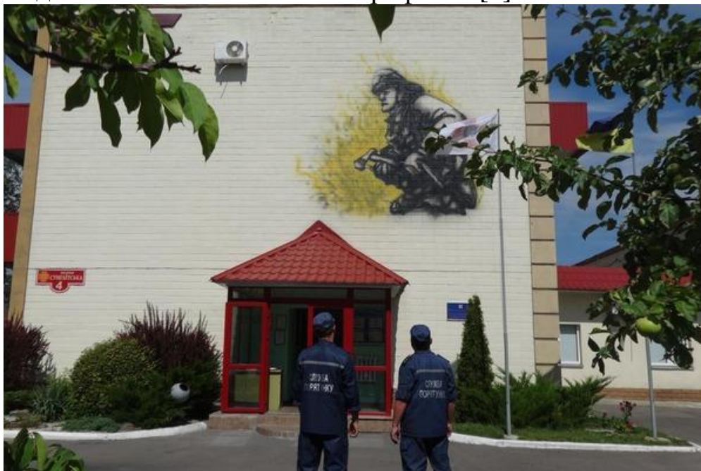
Рис. 4. Мурал на будівлі пожежно-рятувальної частини.

До третьої групи можна віднести мурали, присвячені певним видам фахової діяльності. Прикладом цього є мурал на будівлі пожежно-рятувальної частини в Південно-Західному районі Черкас (Рис. 4). Його автором є місцевий художник Андрій Коломієць. На малюнку зображено рятувальника, який поспішає на допомогу, до місця надзвичайної події. Увага звернена до важкої та небезпечної роботи рятувальника. За словами А. Коломійця, «ця тема добре підходить не лише для пожежно-рятувальної частини, а й для житлового мікрорайону, оскільки привертає увагу до проблем попередження пожеж та до поважної та шанованої професії» [8].