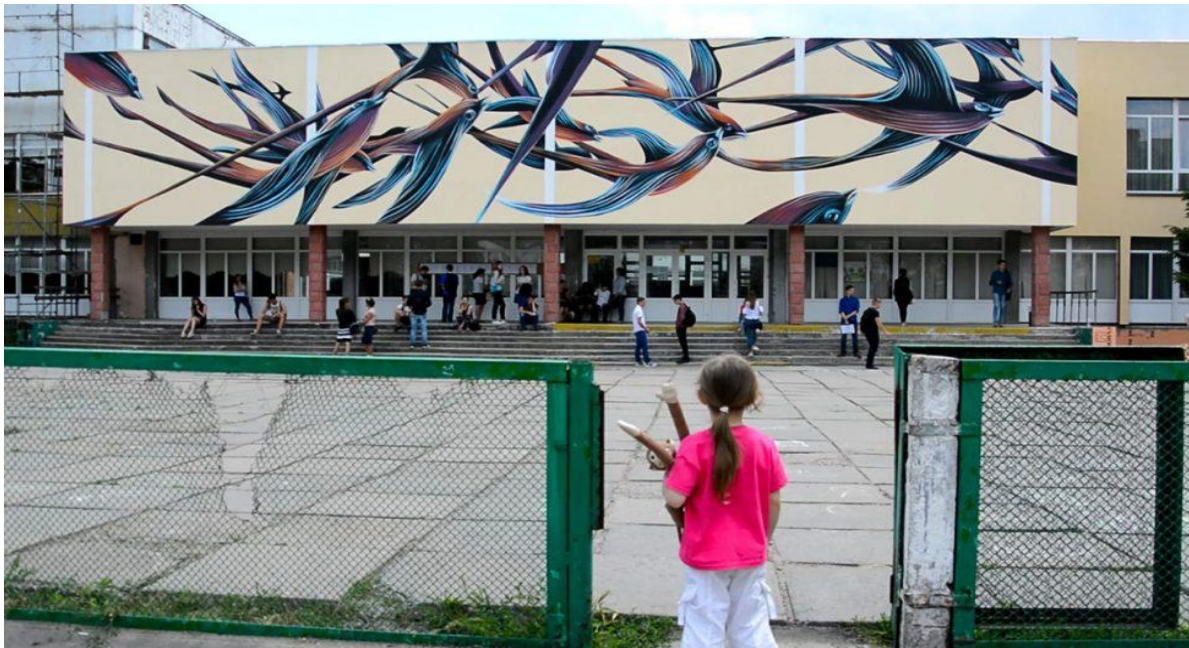
Рис. 2. Мурал, виконаний на школі №1 м. Черкаси.

Ще один мурал виконаний на фасаді черкаської школи №28. Він називається «Весна», на ньому зображені різнобарвні квіти і птахи (Рис. 3). Мурал виконаний членами Черкаської молодіжної ради, автором проекту є Катерина Колесник. Фінансування проекту здійснювалося мерією Черкас. За словами школярки Анни Поліщук, «набагато краще проходити повз школу і дивитися на ці яскраві малюнки, на поєднання цих кольорів, Це красивіше споглядати ніж коли це буде похмуро і однотонно. Цікаво дивитися, споглядати і кожен це бачить по-своєму, кожен в цьому знаходить якісь свої особливості» [7].