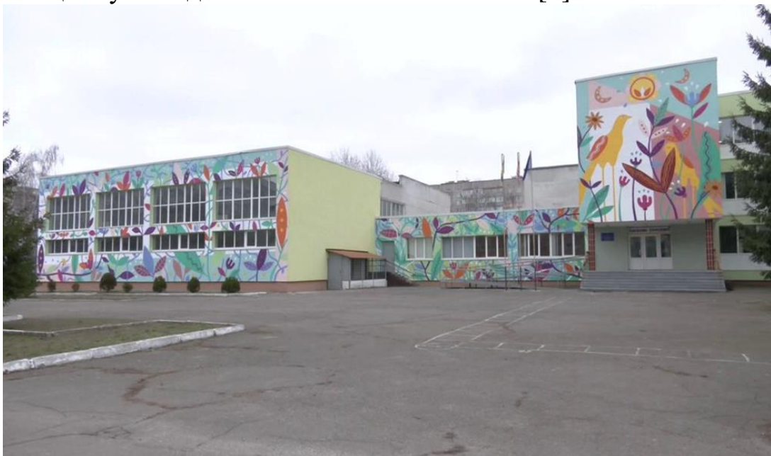
Рис. 3. Мурал на школі №28 м. Черкаси.

Ще один мурал виконаний на фасаді черкаської школи №28. Він називається «Весна», на ньому зображені різнобарвні квіти і птахи (Рис. 3). Мурал виконаний членами Черкаської молодіжної ради, автором проекту є Катерина Колесник. Фінансування проекту здійснювалося мерією Черкас. За словами школярки Анни Поліщук, «набагато краще проходити повз школу і дивитися на ці яскраві малюнки, на поєднання цих кольорів, Це красивіше споглядати ніж коли це буде похмуро і однотонно. Цікаво дивитися, споглядати і кожен це бачить по-своєму, кожен в цьому знаходить якісь свої особливості» [7].