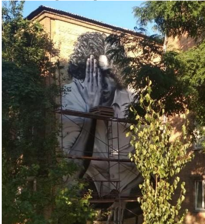
Рис. 1. Мурал «Кузьма Скрябін».

Перша включає мурали суспільно-політичного звучання. До цієї групи належать мурали на історичні теми, ті, на яких зображені герої українського народу, а також сучасні громадські діячі, незалежно від їх фаховості. На нашу думку, до цієї групи відноситься, зокрема, мурал, що зображує відомого музиканта Кузьму Скрябіна (Рис. 1). Він був відкритий у серпні 2020 р. Його замовниками були мешканці самого будинку на вул. Чехова, 60. Важливу участь у його створенні відіграла громадська організація «Протекторат» [5].